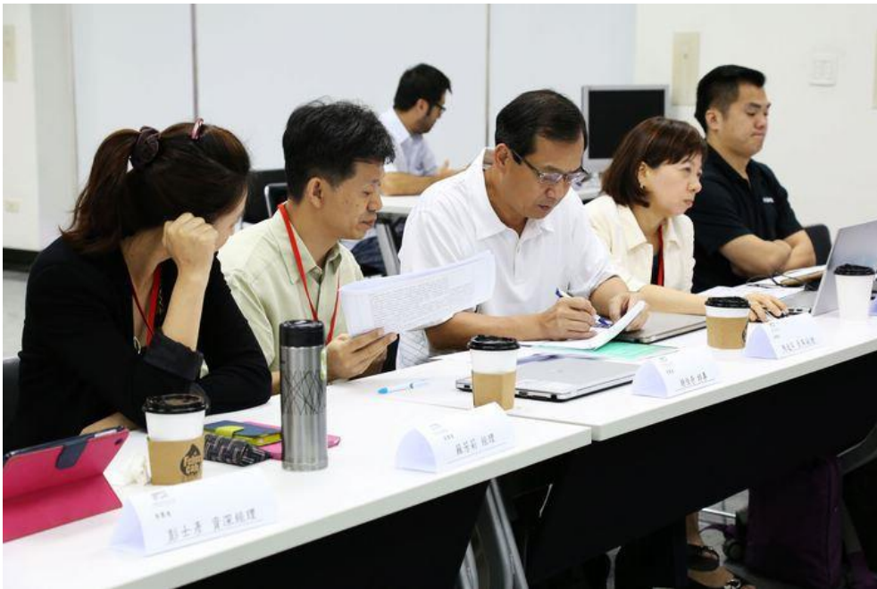
圖、企業導師認真討論各創新團隊

企業導師在行業間有相當豐富的實務經驗，對參賽隊伍的提問常一針見血，除了最基本的獲利模式、公司的成長方向？如何開拓國際市場；因第三屆的多支參賽隊伍提出的產品與雲端整合服務相關，企業導師重視參賽團隊的產品如何結合雲端運算資料，產生給用戶具有價值的服務？用戶使用這些服務時？資安系統建置是否能完善的保護用戶？企業導師也關切讓產品達到普及性的難易度？或是這些新創公司對市場的人性心裡與劇烈變化有何應變機制。