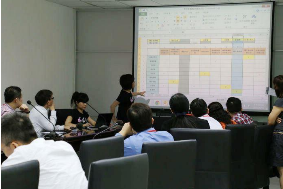
圖、進行企業導師第二次媒合協商

為提高媒合機率，在公布企業導師與參賽隊伍的一對一直接媒合名單後，被超過一家企業導師的選擇的參賽隊伍，進入二次媒合協商。