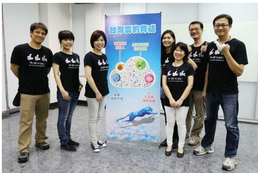
圖、雲豹育成小組大合照