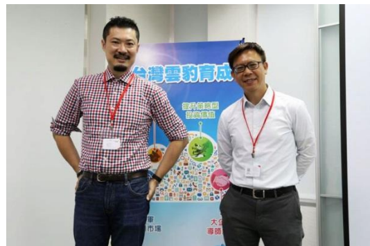
圖(右)、遠傳電信企業導師代表