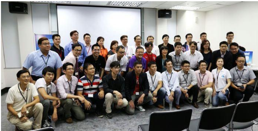
圖、第三屆雲豹育成媒合團隊與導師

第三屆台灣雲谷雲豹育成，自四月底收件後，吸引了多達 80 個新創隊伍參賽，經過面試與初選後，選出 25 支隊伍進入複賽。這 25 支隊伍所提供的新創服務包含雲端監控與偵測、雲端服務平台、數據分析…，在複賽中將由企業導師來評選出與自身企業能量連結的團隊並進行媒合，過程中企業導師在聽取參賽團隊產品簡報展示，及問題提問後，再個別深入了解參賽團隊的產品服務，經由討論、協商，總計有 20 支團隊媒合成功，將會進入近 5 個月的輔導育成期，最後於 2015 年底進行決賽，爭取一百萬元的獎金。