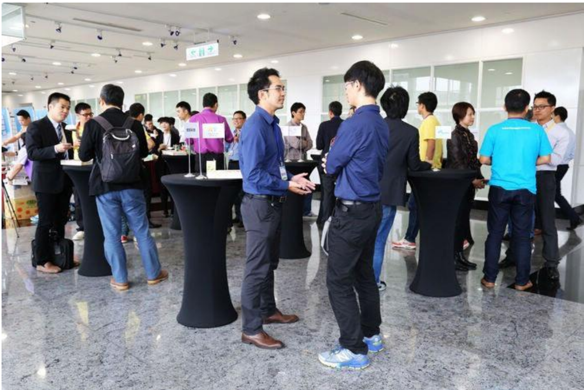
中場休息，大夥都利用交流區互相討論交換意見

參與過雲豹育成的新創公司最稱許的是，雲豹育成把參與的所有團隊組織成社群化的互動交流平台，不需要關在辦公室，是開放式的互相交流、互相推薦、進行創投磋商，亦是合作亦是競爭，兄弟登山各自努力。中場休息時間各團隊紛紛聚集與評審或企業導師交流。