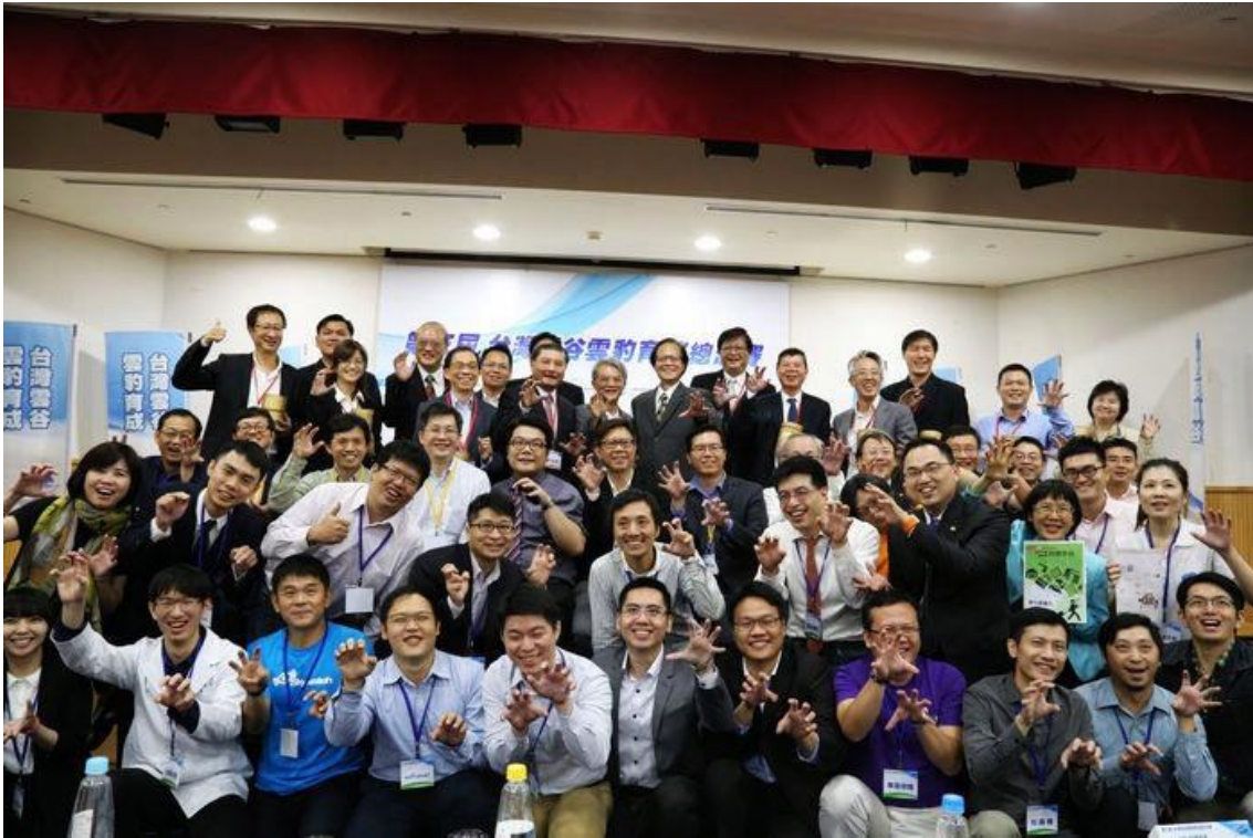
企業導師、創投、創業團隊一起雲豹一下!!

在 2016 年，雲豹育成將由工研院中獨立出來，持續招募新創團隊加入【大企業定向育成】，協助尋找輔導、合作對象。參與競賽後，挑戰未結束，仍需持續創新思考，創新思考非僅限於技術上的創新，而是運用現有的技術、資源、新的觀念整合成新的服務生態圈、商業模式，引領企業轉型、讓人類生活更美好。