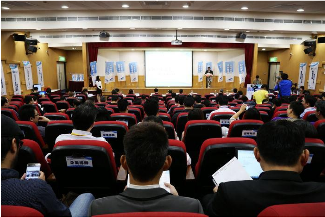
會場滿滿的創業團隊、投資人、大企業代表

參與過雲豹育成的新創公司最稱許的是，雲豹育成把參與的所有團隊組織成社群化的互動交流平台，不需要關在辦公室，是開放式的互相交流、互相推薦、進行創投磋商，亦是合作亦是競爭，兄弟登山各自努力。中場休息時間各團隊紛紛聚集與評審或企業導師交流。