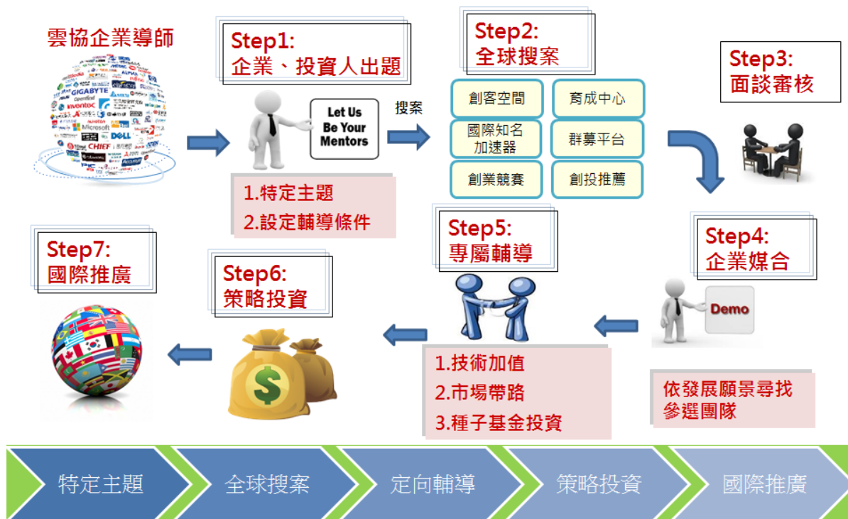
雲豹育成計畫運作流程