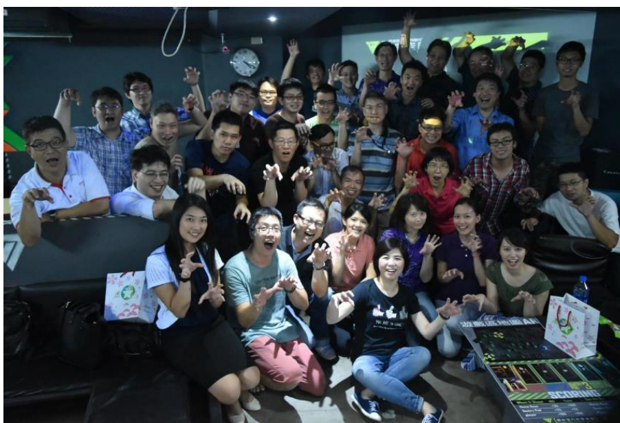
圖2、生存遊戲現場大合照

雲豹育成邁入第四年，除了有強大的企業導師群的指導之外，也已經累積了前三屆共 42 家新創企業。新創企業之間有許多共同話題，而今年的團隊更能運用強大的學長學姐團，透過了解學長姐的創業經驗，避免走太多冤枉路。雲豹歷屆以來，從雲技術創新、線上社群、O2O、室內定位、智能硬件、植物工廠等，各行各業的科技創新齊聚，更是一個極具開發與合作潛力的社群。因此，我們特別於 8/4 舉辦了【星創之夜-第四屆雲豹團隊開訓典禮】，希望透過此活動，能快速打破各界的藩籬，進新創企業跨屆之間的互動及交流。目前的確已經產生效果，團隊已開始陸續安排讀書會、企業參訪等交流活動。