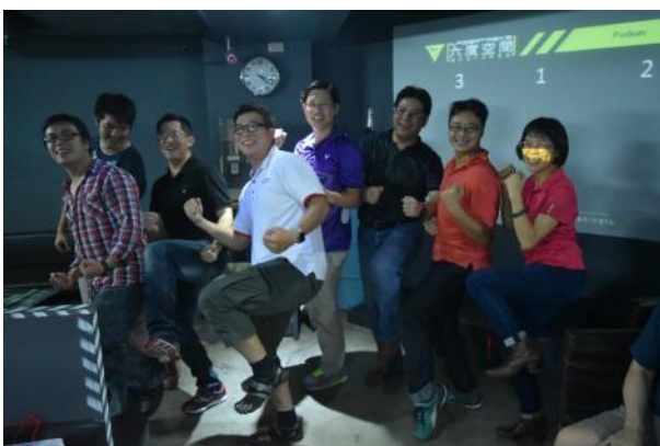
圖3、 創業家族同心協力完成任務

當晚舉行的【星創之夜】接著安排學長姐及今年新進的雲豹團隊進行互相交換創業帖子的小活動，讓團隊們互相分享自身團隊的核心產品服務，及創業過程中經歷過的苦甜酸辣。