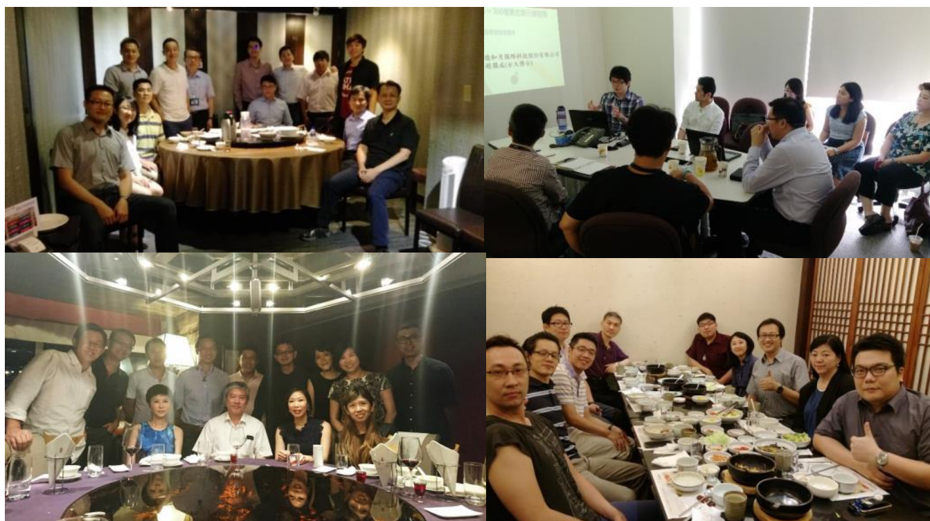
圖1、導師相見歡及初次輔導會議

這次輔導的開始特地安排企業導師與團隊一同聚餐，在較為輕鬆的氛圍之下，讓大家先互相認識，建立起互信的基礎。同時，在比較輕鬆的氛圍下，也讓大家更能一起聊聊創業的目的，心路歷程，讓企業導師能對各個創業家有基本的認識。