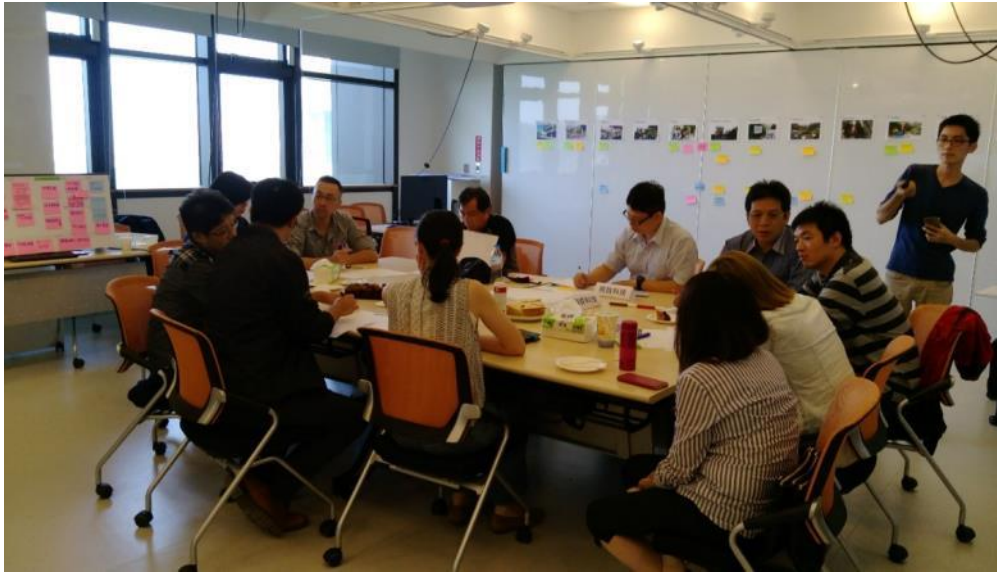
團隊共同規劃 3、4D 劇本

經過 1D 平面劇本及 2D 的鳥瞰場景探觸活動之後，團隊們發現所有的產品及服務都能利用“新竹市立動物園一日游”的主軸將各自的產品服務全部串聯起來。以新竹市立動物園為主軸的劇本，除了能為訪客帶來更多有趣、便利的服務，同時也為動物園本身導入創新的服務及用戶價值，所以雲豹團隊們便集結在一起，共同規劃 3D 場景及 4D 的劇本。