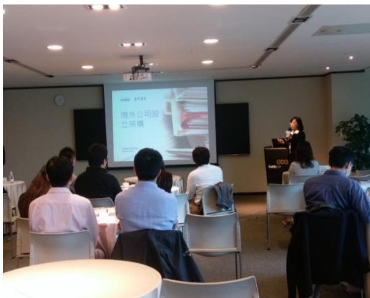
財務夥伴-KPMG 專場輔導

除了從產品服務面協助新創公司之外，11/23 也特地請到 KPMG 的執業會計師及資深法律顧問專門為雲豹的新創團隊帶來【如何與投資人交涉之法律與實務技巧】研討會。第四屆雲豹育成的創業團隊們在經過半年的輔導及決賽之後，皆獲得許多投資人的青睞，但卻普遍無法與投資人在同一頻率上溝通，也缺乏擬定出正確投資規劃的能力。因此，雲協的會員 KPMG，同時也是雲豹育成的財務顧問，在經手許多案件盤點及討論之後，決定加開此專場研討會，協助新創公司常碰到的投資條款及境外公司設立建立基本的概念。