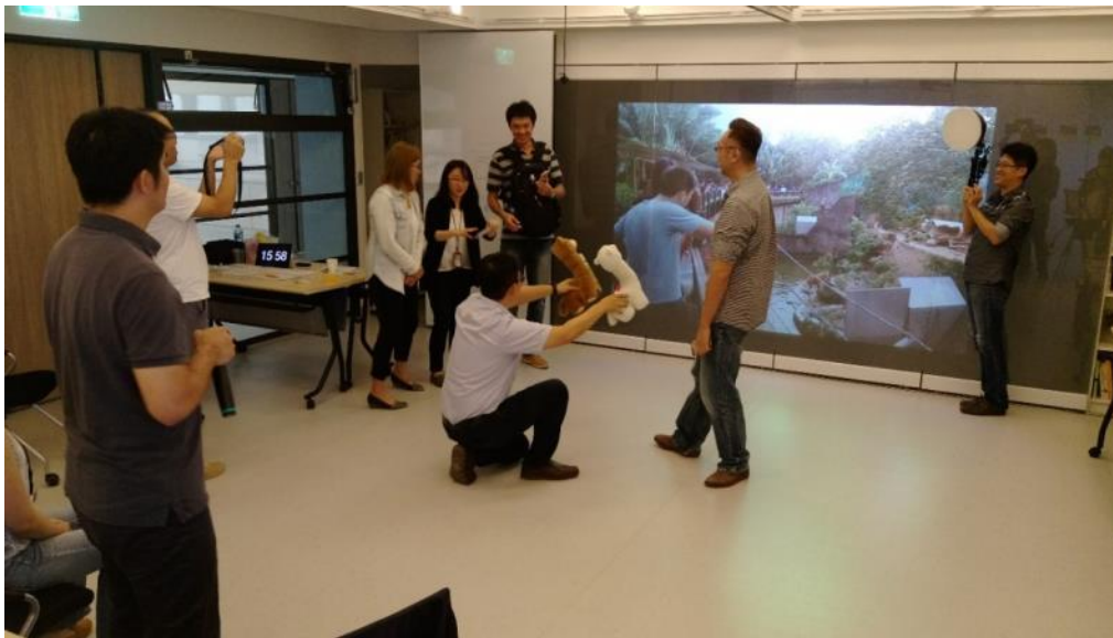
4D 經驗場景探觸歷程

經過 1D 平面劇本及 2D 的鳥瞰場景探觸活動之後，團隊們發現所有的產品及服務都能利用“新竹市立動物園一日游”的主軸將各自的產品服務全部串聯起來。以新竹市立動物園為主軸的劇本，除了能為訪客帶來更多有趣、便利的服務，同時也為動物園本身導入創新的服務及用戶價值，所以雲豹團隊們便集結在一起，共同規劃 3D 場景及 4D 的劇本。