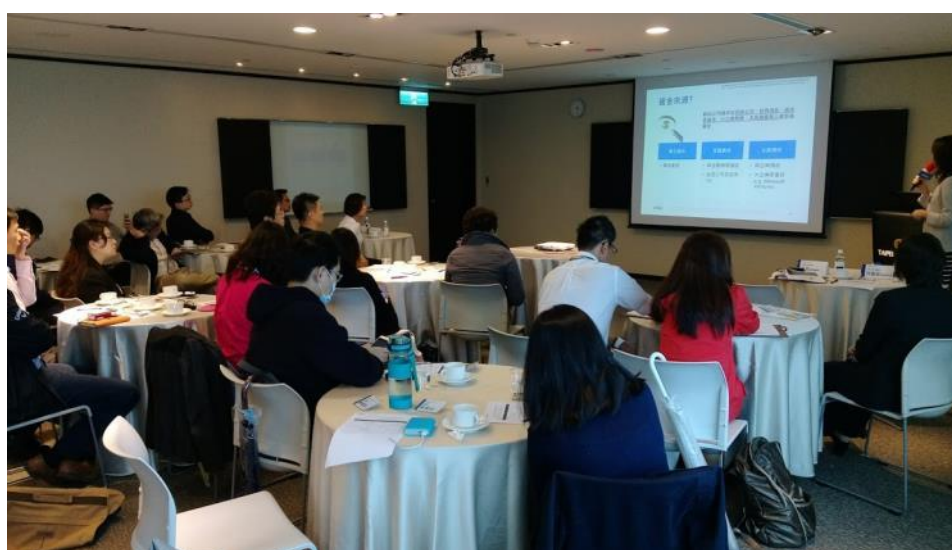
KPMG 執業律師對雲豹團隊講解境外公司設立架構

此次研討會聚焦在境外公司設立架構及與創投交涉法律議題兩個主題上。KPMG 的執業會計師為新創團隊介紹需要設立境外公司的不同狀況，同時也講解了如何選擇設立境外公司的地區，分析各地區設立公司的流程及上市特別注意事項。