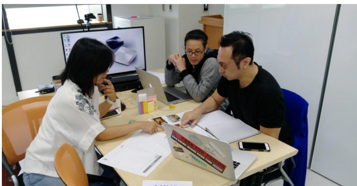
雲豹第四屆誠映(Akubic)團隊成員認真地討論 1D 平面劇本

應用劇本善於利用“劇本導引”的方式帶領團隊重新探索、思考產品或服務的使用者體驗，合作過的對象包含華碩、偉創、台積電、工研院、全家便利商店等。工作坊當中，應用劇本帶領雲豹團隊透過四種不同角度（1D 平面劇本洞察場景探觸需求、2D 鳥瞰場景探觸活動、3D 等比場景探觸互動、4D 經驗場景探觸歷程）探討使用者在使用過程當中實際的體驗流程及用戶價值。