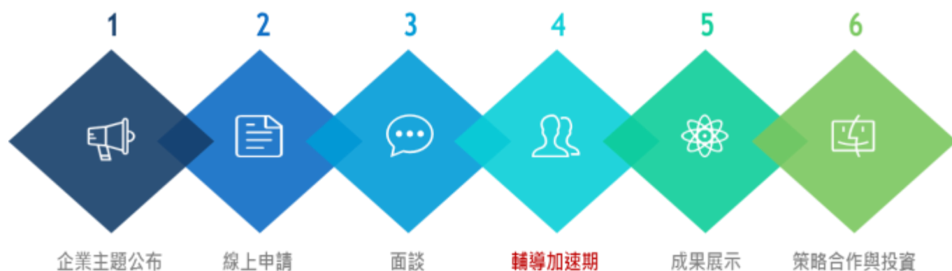
圖、雲豹育成輔導流程

雲豹育成的輔導流程，從企業主題出發啟動更精準的篩選、媒合、輔導、策略投資，締造出實質的創新加速模式：