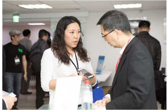
圖：主題說明會企業導師-英業達(左)與台灣大哥大(右)與新創團隊交流熱烈

企業導師持續招募中，歡迎雲協的會員們踴躍參與雲豹育成企業導師，除了能進入雲豹創業家社群，掌握歷屆雲豹新創團隊動態，並可針對企業內部的產品服務方向指定題目，享有優先看案權與優先投資權！