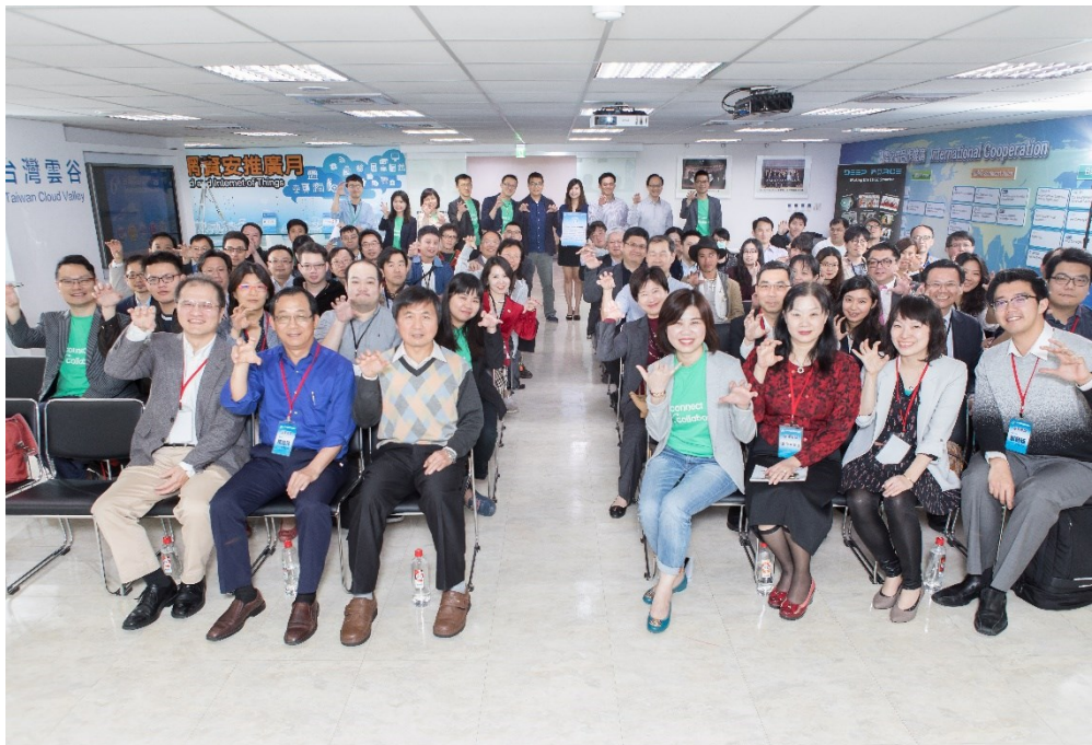
圖：台北場說明會現場嘉賓雲集，見證第六屆雲豹育成計畫啟動

第六屆雲豹育成企業導師有工研院、中華電信、台灣大哥大、台達電、英業達、研華科技、凌群電腦、遠傳電信等，出題的方向圍繞在人工智慧、物聯網、大數據、雲端應用等，證明人工智慧相關產業強勢出線，同時也代表雲端物聯網創新應用的市場潛力仍然有強勁的力道。